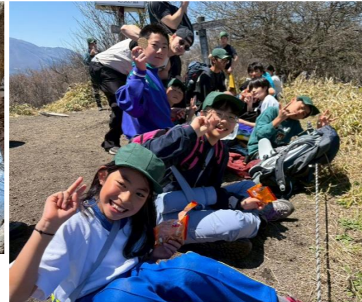
浅間隠山ハイキング